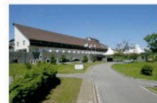
ガトーキングダム小海